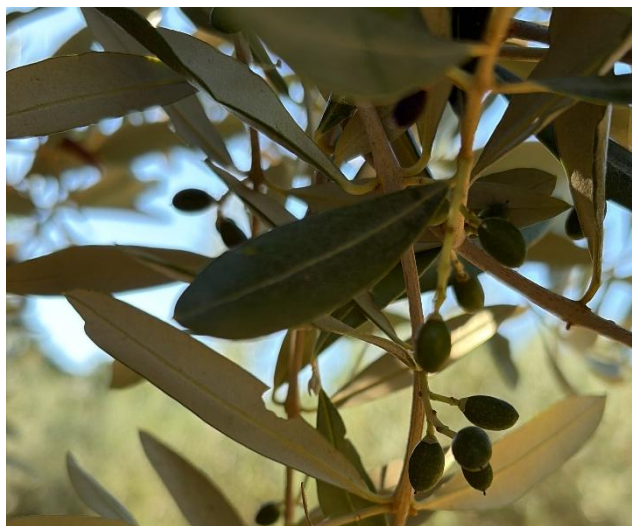
Foto 3 e 4. Varietà Leccino Polcenigo (PN) e a Montereale Valcellina (PN)