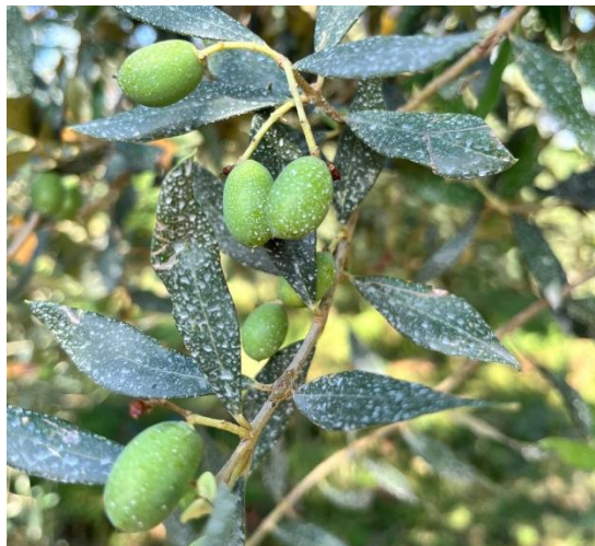
Foto 1 e 2. Varietà Bianchera a San Quirino (PN) e a Lestizza (UD)