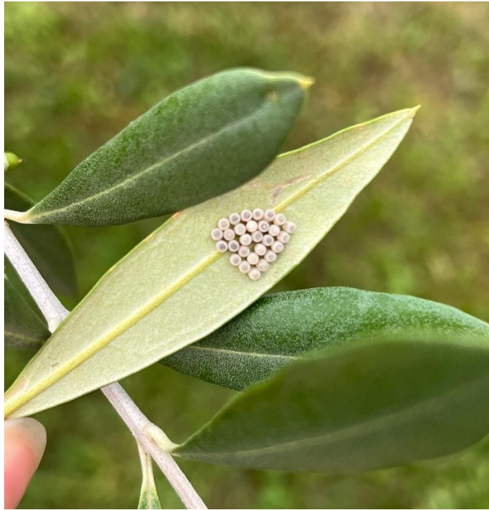
Foto 5. Nella foto ovatura di Halyomorpha halys non schiusa: hanno una forma tipica e un numero di uova di circa 28 ciascuna.

In previsione di un periodo di stabilità meteorologica, si raccomandano le seguenti strategie di intervento: