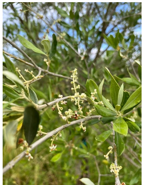
Foto 1 e 2. Varietà Bianchera a Lestizza e Majano